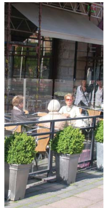
Exempel på genomskiktlig skärm med höjd 1,4m

Kommunens trottoarer, gångbanor och torg är till för gående. Här inkluderas självfallet personer med nedsatt rörelse- och/eller orienteringsförmåga. På gångbanor med mindre gångtrafik ska det alltid finnas minst 1,5m fri passage och på gångbanor med större gångtrafik minst 2,0m. Vid huvudstråk och på torg ska det fria måttet vara minst 3,0-4,0m. Förekommer träd, vägmärken, parkeringsautomater, cykelställ, belysningsstolpar eller andra gatumöbler på trottoarer medför detta att den möjliga ytan för uteserveringar minskar, då det fria måttet inte får innehålla några hinder. Uteserveringens yttermått inkluderar såväl blomlådor, menyskyltar, staket som övriga anordningar. Dessa får alltså inte placeras utanför serveringens avgränsning.