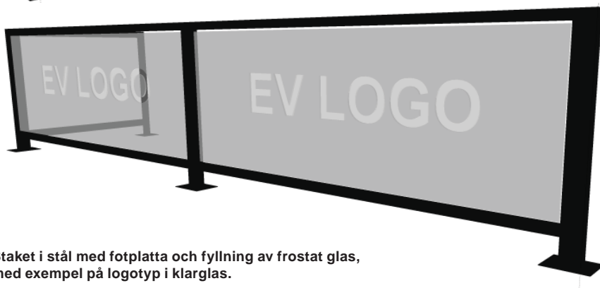
Staket i stål med fotplatta och fyllning av frostat glas, med exempel på logotyp i klarglas.